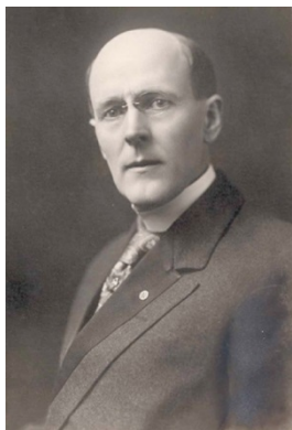
Paul Percy Harris